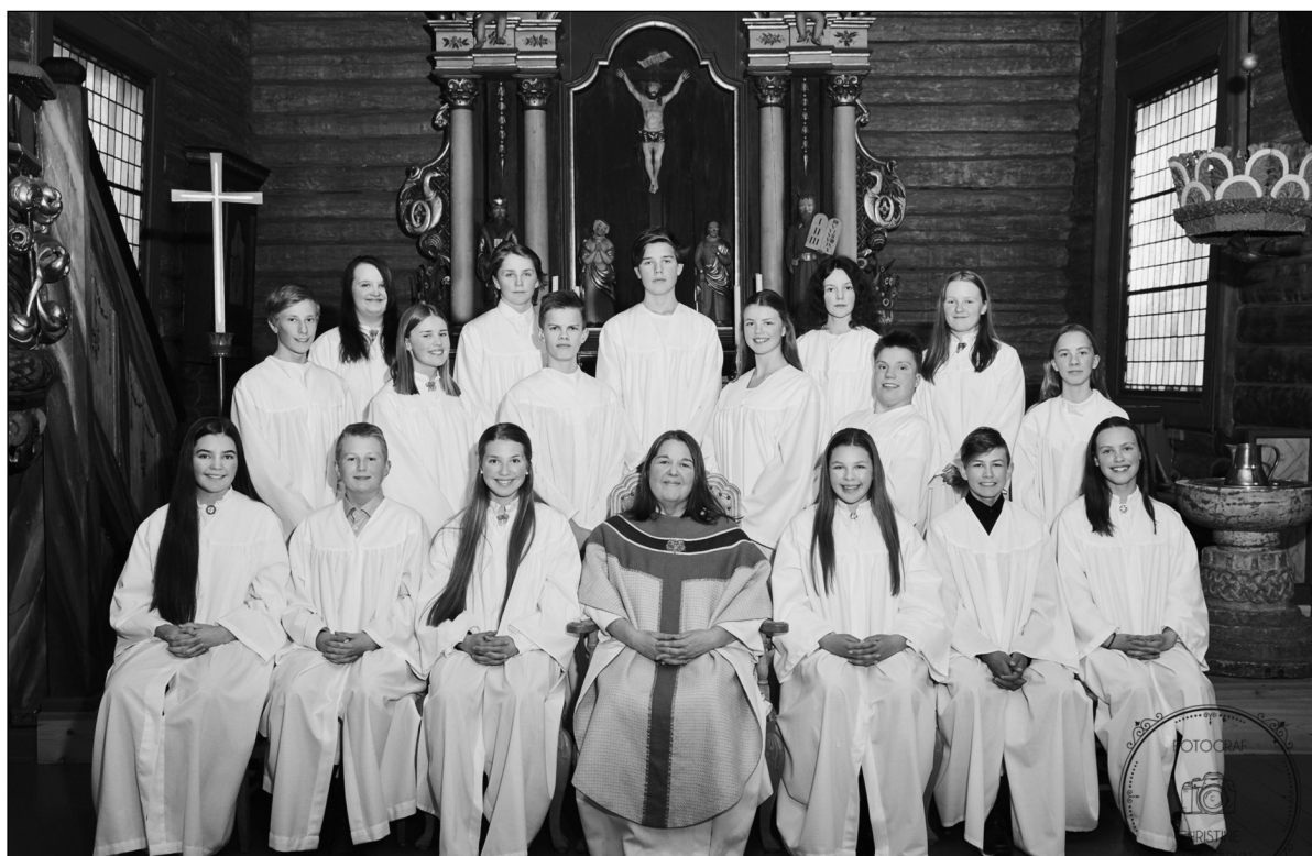
I alt 50 ungdommer skal konfirmeres i Nord-Aurdal i mai. Vårt bilde er fra fjorårets konfirmasjon i Aurdal kirke.